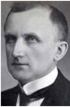
Prof. Kamil Krofta